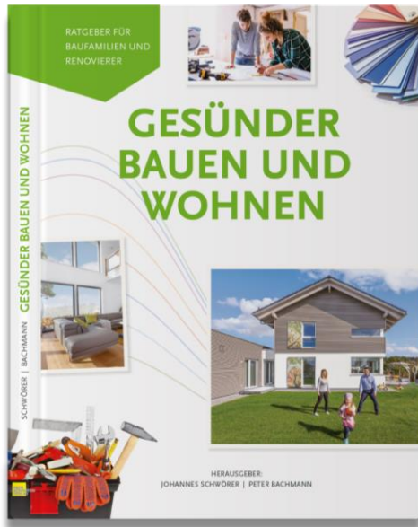
Abbildung Titel Gesünder Bauen und Wohnen 2

Verbindungen (TVOC) sinken spätestens nach den ansonsten für Raumlufmessungen üblichen Wartezeit von vier Wochen in unbedenkliche Bereiche. Quelle: Studie „Gesundheitliche Qualität im Holzfertigbau“, Sentinel Haus Institut / SchwörerHaus