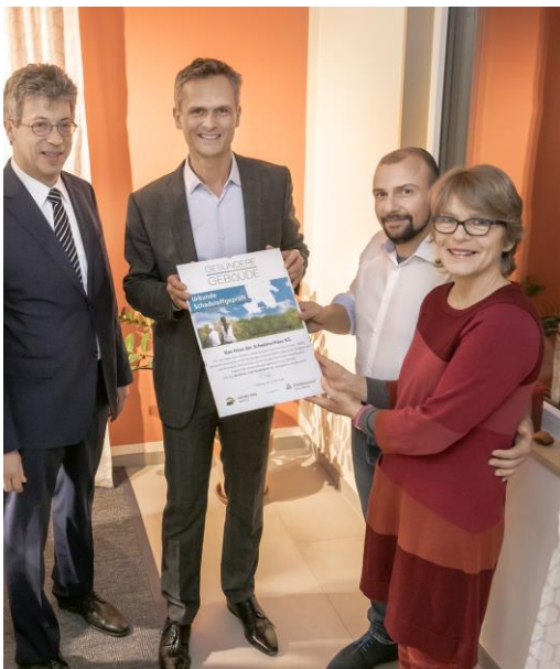
Uebergabe Urkunde Prüfbescheinigung Raumluftmessung

Im Rahmen der Studie „Gesundheitliche Qualität im Holzfertigbau“ wurde mit Erfolg untersucht, wie Baufamilien ihre Eigenleistungen geprüft wohngesund durchführen können.