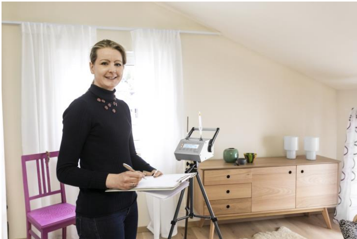
Raumluftmessung Sentinel Haus Institut

Messungen nach offiziellen Standards bestätigen die gute Raumluftqualität.