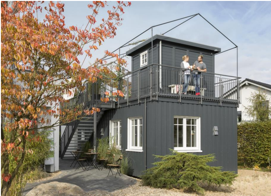
GreenLivingSpace aussen

Das transportable Minihaus Green Living Space von SchwörerHaus vereint gesünderes Bauen mit spannenden Wohnideen und topaktueller Haustechnik für mobile, weltoffene Kunden jeden Alters.