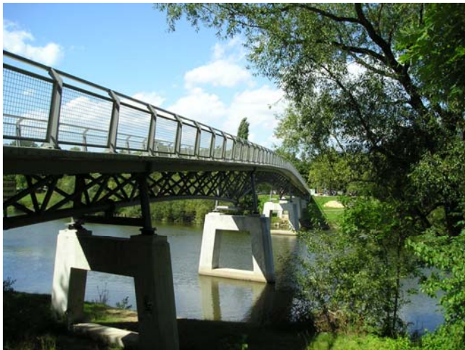
Gärtnerplatzbrücke in Kassel aus ultrahochfestem Beton

Ein Beispiel ist die Gärtnerplatz-Brücke Fulda in Kassel. Diese Brücke hat eine Länge von 140 m und Deckplatten von nur 8 bis 12 cm Dicke. Sie wurde als erstes größeres Bauwerk in Europa aus ultra hochfestem Beton gebaut (siehe Foto).