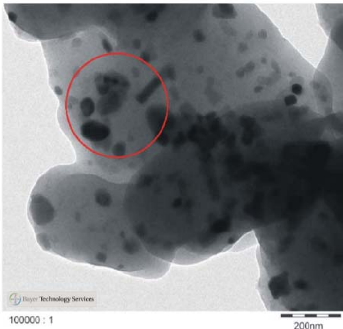
Abbildung 1: Nanopartikel in Abriebteilchen gebunden

Universität Dresden zur Freisetzung von Zinkoxid-Nanopartikeln aus Beschichtungen (Parkettlack, Möbellack) zeigen, dass während der normalen Nutzung Nanopartikel nicht freigesetzt werden. Sie bleiben fest in dem dabei entstehenden Abrieb eingebunden und werden nicht aus der Matrix herausgelöst (siehe Abbildung 1)[4].